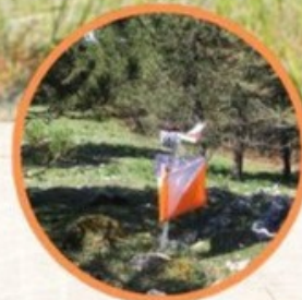
ORIENTEERING IN CENTRO STORICO E NEI BOSCHI

L'Orienteering, anche detto "lo Sport dei Boschi", è inclusivo e multidisciplinare, permette di stimolare tramite esercizi individuali o di gruppo la capacità di risolvere enigmi e superare ostacoli che possono presentarsi sia nello sport che nella vita.