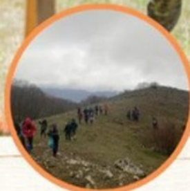
TREKKING ALLA SCOPERTA DEI MONTI SIMBRUINI