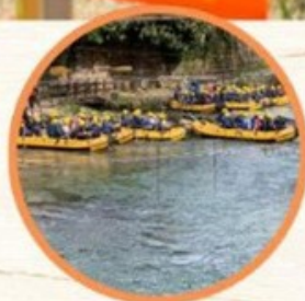
SOFT RAFTING SUL FIUME ANIENE IN TUTTA SICUREZZA