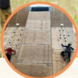
ARRAMPICATA PARETI ATTEZZATE ALL'APERTO E AL CHIUSO