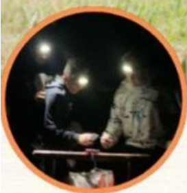
ORIENTEERING IN NOTTURNA IN AREE DEDICATE